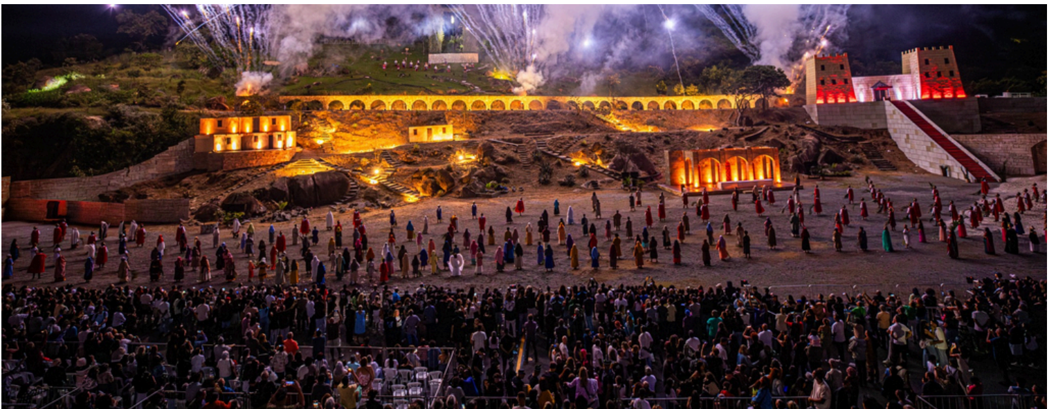
Entre os dias 2 e 4 de abril, o Drama da Paixão reuniu milhares de pessoas e promoveu fé e tradição