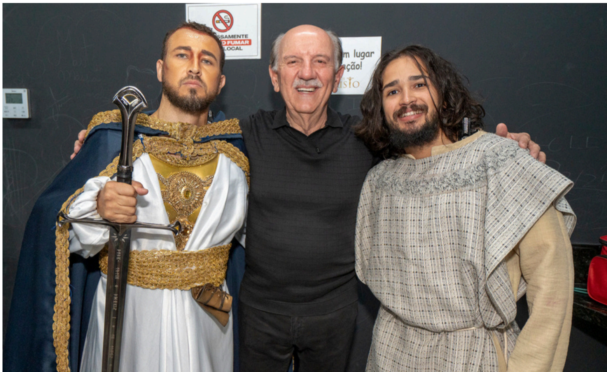
Prefeito de Barueri, Beto Piteri, acompanhou uma emocionante apresentação da Paixão de Cristo na Praça das Artes, em uma noite marcada por fé, cultura e reflexão

Com uma produção envolvente e elenco dedicado, a encenação retratou momentos importantes da história de Cristo, proporcionando ao público uma experiência significativa. Durante a ocasião, o prefeito destacou a importância da iniciativa e agradeceu aos participantes. “Quero agradecer a todo o elenco e aos profissionais que se de-