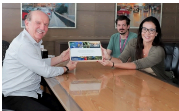
Barueri recebe Certificado Safira e é destaque em gestão pública sob Piteri

Segundo o prefeito, a conquista é resultado de um trabalho integrado entre as secretarias, com foco na transparência e no uso responsável dos recursos públicos. A certificação reforça o avanço de Barueri em desenvolvimento sustentável e qualidade de vida, consolidando o município como referência.