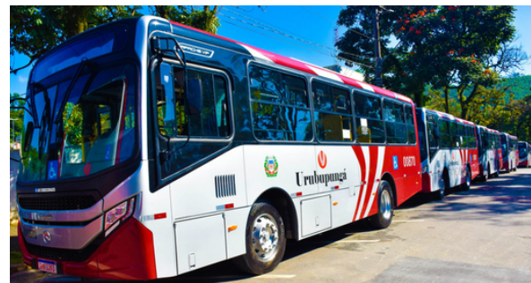
Nova lei assegura isenção tarifária no transporte municipal e amplia o acesso

Para ter acesso, é necessário residir no município, apresentar laudo médico atualizado que comprove o diagnóstico e o tratamento ativo, além de ter renda familiar per capita de até dois salários mínimos. O cadastro deve ser feito na Central de Atendimento da BEM.